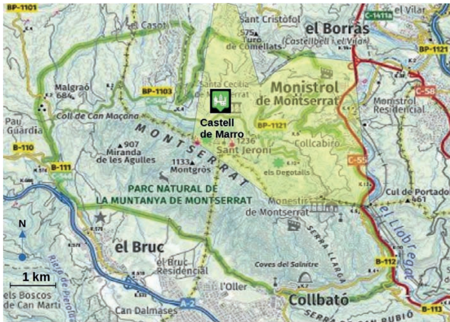
Figura 2. Dominis del castell de Marro, una tercera part del parc natural de Montserrat