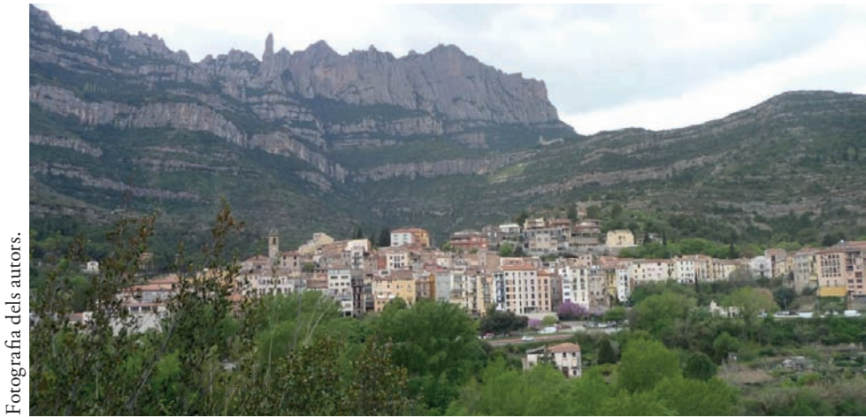
Figura 6. Vista actual Roca Cavall Bernat Rupis Bernardi , Monistrol de Montserrat

Les indicacions toponímiques del document de confirmació de bens posseïts per aquest monestir corroboren la ubicació del seu predi en possessió de l'abat Cesari. Aquest document és el Precepte de Lluís d'Ultramar, que afirma que el predi es troba en el castell de Marro de Montserrat. I igual que el document anterior, diu quins terrenys inclou el predi del monestir. El document indica que el predi va de la porta del castell fins a la Roca Bernardi, la roca vocatur Rupis Bernardi , tot íntegre. És a dir, arriba fins al Cavall Bernat. Ja hem dit abans que sembla que el document és incomplet en la descripció dels termes d'aquesta possessió de Santa Cecília. Cal considerar que aquest seria una còpia de documents anteriors. En aquest document hi mancarien altres afrontacions termenals del predi. La indicació de la Roca Cavall Bernat constata que es tracta del mateix indret dels documents anteriors on es parla d'aquesta roca.