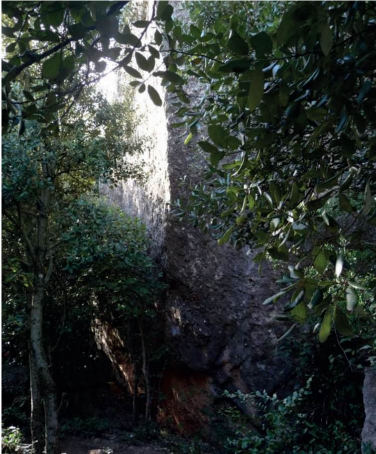
Figura 5. La gran roca esderrocada que trobem al camí de l'Arrel, entre d'altres