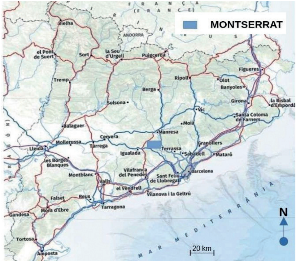
Figura 1. L'espai geogràfic de Montserrat dintre de Catalunya