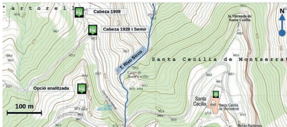
Figura 7. Tres ubicacions probables del castell de Marro

Font: Mapa elaborat pels autors amb Instamaps sobre mapa de l'ICGC.